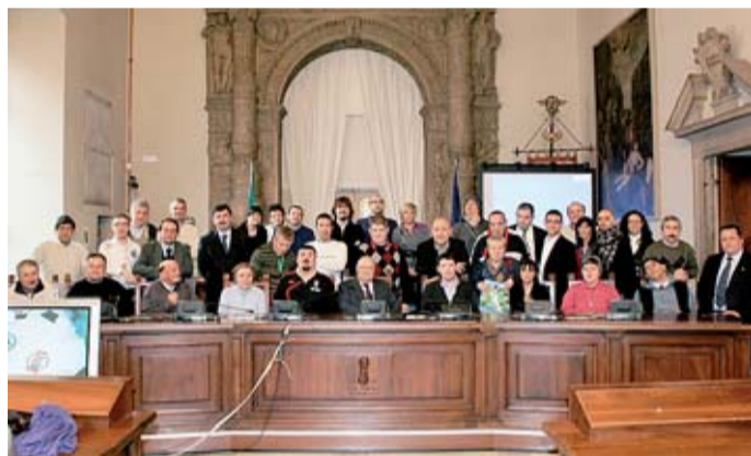
Le autorità con i protagonisti. A destra un ospite col calendario